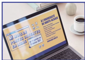
Du 16 janvier au 13 février Portes ouvertes en ligne