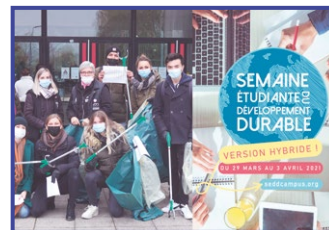
29 mars Semaine étudiante du développement durable avec une « Clean walk »