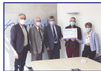
27 avril Remise de dons, en faveur des étudiants en situation de précarité, de la part du Rotary et du Lions Club à la Fondation Partenariale Haute-Alsace (FPHA)