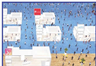
21 et 22 janvier Journées des Universités en ligne