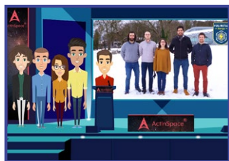
5 février Finale internationale du concours ACTINSPACE 2020 remportée par le laboratoire GRE de l'UHA