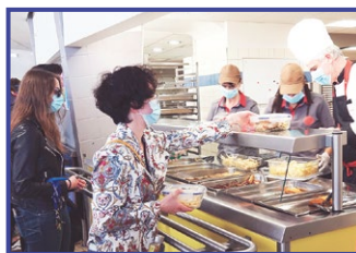
23 avril Distribution de bocaux réutilisables aux étudiants