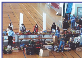
6 et 11 mars Distribution de sacs solidaires et de colis alimentaires aux étudiants