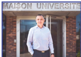
25 janvier Élection de Pierre-Alain Muller à la Présidence de l'Université de Haute-Alsace